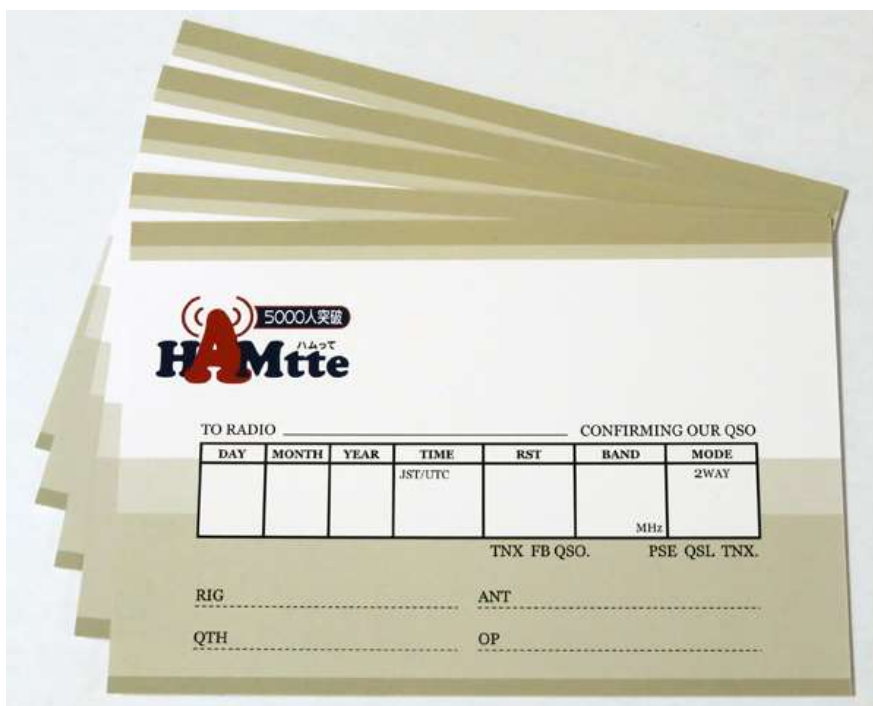
HAMtte メンバー5,000 人突破記念の規格 QSL カード