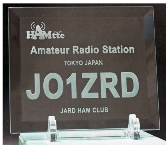
特製コールサインプレートの見本 （抽選で10名に贈呈、当選者様のコールサインとお名前を刻印します）

※HAMtte メンバーとの交信が1局も記載されていない書類を提出された場合は、20局参加賞、賞品抽選権の対象となりません