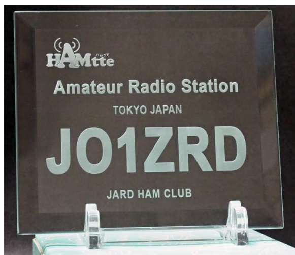
特製コールサインプレートの見本 （抽選で10名に贈呈、当選者様のコールサインとお名前を刻印します）

※HAMtte メンバーとの交信が1局も記載されていない書類を提出された場合は、20局参加賞、賞品抽選権の対象となりません